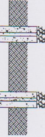
รูปด้านหลัง SCALE 1:25