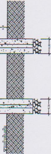
รูปด้านหน้า SCALE 1:25

หมายเหตุ - ท่อต้องฝังด้วยดินเป็นึกหนัก 2 ครั้ง - ท่อจริง (สีเขียว) ค่าเฉลี่ยมีน้ำหนัก 2 ครั้ง - ตัวหนังสือ (สีขาว) เขียนด้วยสีน้ำมัน