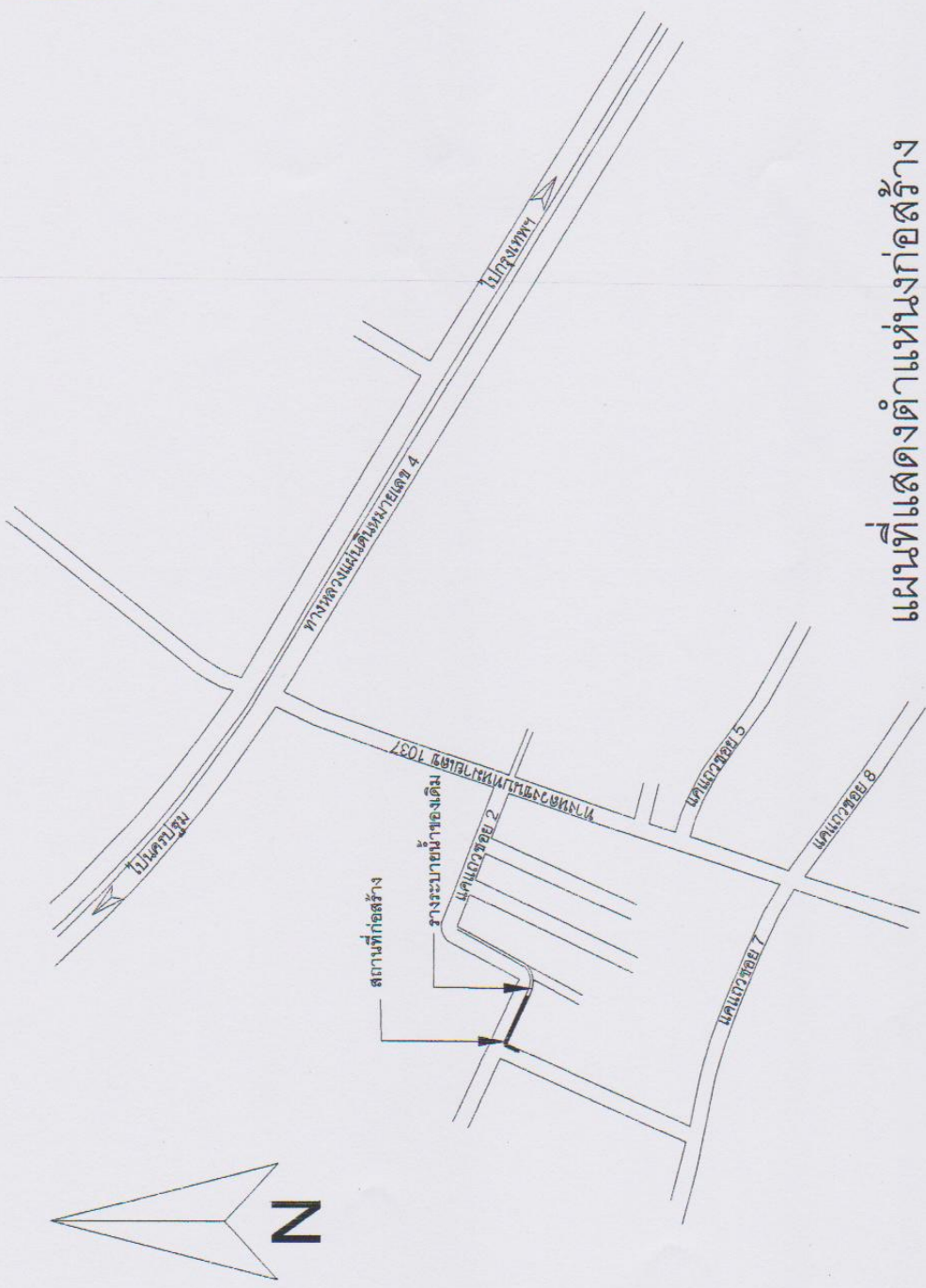
แผนที่แสดงตำแหน่งก่อสร้าง